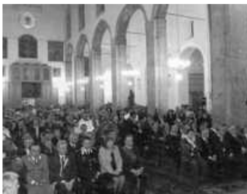
Una fase della cerimonia

Si tratta di una vasta letteratura devozionale affidata agli antichi libri parrocchiali post-tridentini, alle cronache manoscritte del 600, alla Conclusioni dell'Università del 700. Si tratta di un insigne patrimonio reliquario ed ex-votivo che oggi è possibile in parte visionare nel Museo sansossiano di arte sacra allestito nella cripta della chiesa.