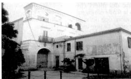
Palazzo de Franciscis, via Parrocchia, Tuoro di Caserta