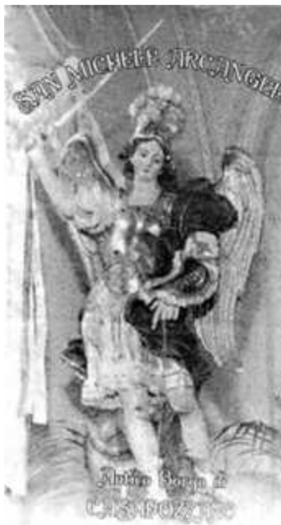
San Michele: drappo devozionale

Il presente lavoro è un piccolo contributo a questa riflessione, e sarà dedicato soprattutto ad offrire nuovi spunti per continuare a delineare i tratti già abbozzati della storia religiosa e della devozione che legano la comunità di Casapuzzano al suo Santo Patrono: l'Arcangelo Michele 1 .