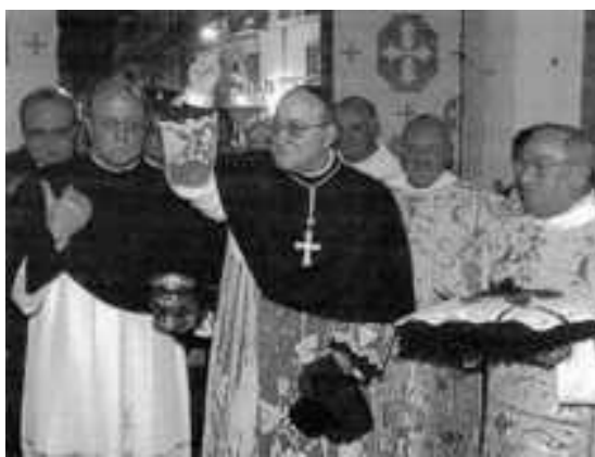
L'ingresso nella Basilica di S. E. l'Arcivescovo M. Milano, dell'Arciprete Parroco don S. Rossi. A sinistra l'On. N. Marrazzo

1. Il titolo di Basilica Pontificia per la Chiesa di San Sossio di Frattamaggiore, munus del Papa Benedetto XVI, è stato solennemente annunciato dall'Arcivescovo Mario Milano durante la celebrazione liturgica del 26 Novembre 2006. Questo titolo viene a conclusione di un percorso di fede e di iniziative realizzato da tutta la Comunità ecclesiale e civile frattese insieme con il parroco Sossio Rossi. Il percorso partito da tempo si è identificato con i momenti religiosi e culturali dell'anno giubilare 2005-2006, indetto per celebrare la memoria del XVII centenario di San Sossio martire campano del IV secolo.