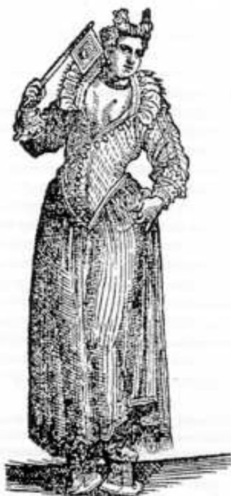
Meretrice pubblica del XVI sec. (da C. Vecellio) 16

libera professionista, arcinota per i prezzi popolari che praticava a guerrieri da tempo al tramonto, ai quali la “Casa di tolleranza”, sita in Via S. Maria della Neve, appariva un lusso oltremodo eccezionale. d) sfruttamento-profitto; fiscalità . La fiscalità è uno dei presupposti ritenuti concretamente pragmatici, strettamente attinenti a responsabilità e competenze di pubblica amministrazione: la prostituzione, considerata al tempo stesso una risorsa di pubblica utilità perché servizio e/o attività redditizia era soggetta a tassazione.