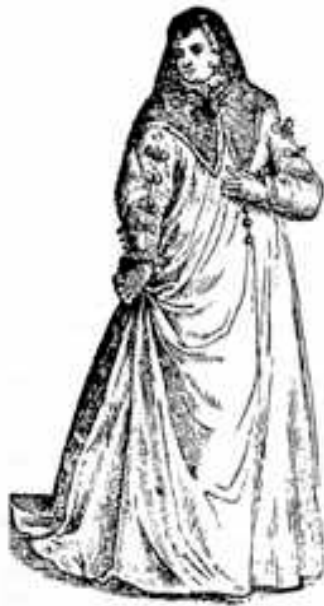
Meretrice pubblica del XVI sec. (da C. Vecellio)

Il primo corso storicamente rilevante, per il soggetto qui trattato, lo troviamo in Grecia. Solone, secondo la tradizione “ acquistò alcune donne e le sistemò in diversi quartieri 10 , pronte e disponibili per tutti 11 ” . Il provvedimento fu adottato per salvaguardare l’onore delle donne libere ed evitare dubbi circa la paternità. Forse, da quel momento, fu esaltata la particolare configurazione della prostituta come spettacolo di miseria, nobilitato (si fa per dire) a rango d’esperienza di vita. Infatti, essa fu vista come target da definire e offrire all’istinto biologico, unicamente per catalizzare bollori, esuberanze ormonali, prove di mascolinità, in nome e per necessità d’ordine sociale oltre che di pace familiare 12 . Poi, in tutto il mondo civile fu un ripetersi di azioni e reazioni, mantenendo salde delle costanti come: a) i luoghi particolari , per tenere separate e distinte le donne inhonestæ da quelle oneste. Così, se per esempio ad Atene il Ceramico assunse la sua famigerata notorietà; in Roma antica, sempre con un identico sottofondo di miseria materiale e morale, l’ambiente fisico del mestiere in questione fu la Suburra, cui tenevano bordone Trastevere e il Circo Massimo. L’ordine che la periferia delle città dovesse essere l’unico luogo che competesse alle prostitute, fu, come si accennerà in