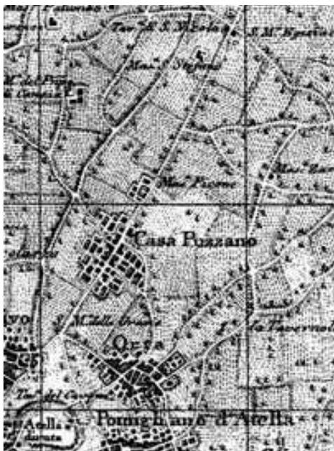
Casapuzzano: l'antica periferia di Atella

Casapuzzano è un borgo situato nell'area periferica della scomparsa Atella, a metà strada tra Capua e Napoli. Esso è un luogo antico ove si notano le persistenze medievali dell'arte e dell'urbanistica (affreschi di scuola giottesca e palazzo baronale), ove si nota la persistenza del tracciato della via che in epoca romana congiungeva la città di Atella con Capua, e ove si nota la persistenza del complesso ecclesiale ed abbaziale di San Michele Arcangelo la cui storia ci rimanda al cristianesimo dell'anno mille e alla vita religiosa dell'alto medio evo in Campania. In questo luogo antico si recuperano gli stimoli e le ragioni per sviluppare alcune interessanti tematiche di carattere storico e religioso e per recuperare la conoscenza di alcuni aspetti interessanti della identità etica e culturale della comunità locale.