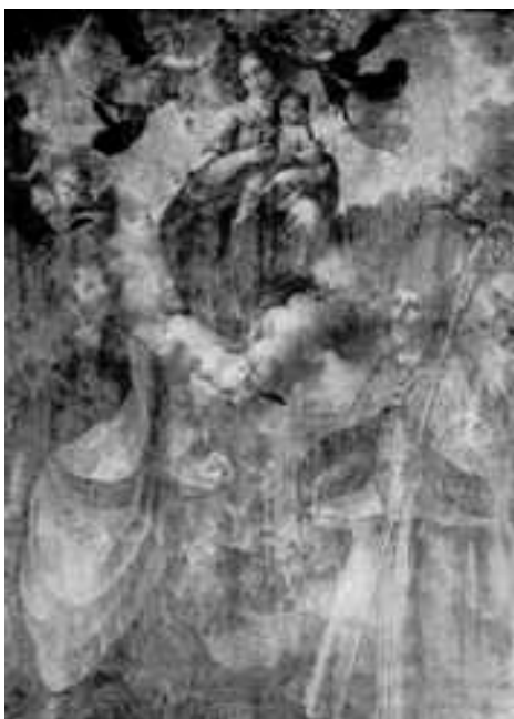
Girolamo Imperato, Madonna con il Bambino e i santi Felice e Marco . Giugliano, Chiesa di San Marco

Il dipinto, posto sull'altare maggiore della chiesa intitolata a san Marco in Giugliano, raffigura la Madonna con il bambino e i santi Felice e Marco , ed è stato segnalato per la prima volta nel 1800, come prodotto di anonimo artista, da Agostino Basile nelle sue Memorie storiche della terra di Giugliano , e poi indicato da Antonio Galluccio come opera del pittore napoletano Fabrizio Santafede 1 .