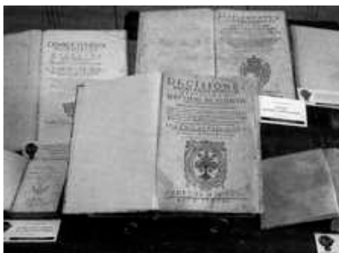
Particolare dei testi in esposizione

Ma tornando alle caratteristiche della nostra biblioteca, esse sono singolari ed originali, tali che non è in competizione con le Biblioteche degli altri Comuni della zona atellana. Inoltre noi abbiamo di essa una concezione dinamica: non solo una sala per ospitare studenti o cultori di storia locale e giuridica, ma un vivo e fecondo laboratorio culturale regionale. Proprio perché siamo impegnati in un'azione continua per la salvaguardia della storia locale, la sede sarà il luogo di un vivace scambio culturale.