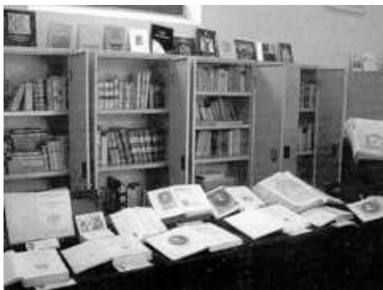
La mostra bibliografica nella sede dell'Istituto

Finalmente Frattamaggiore si presenta nel campo culturale regionale con una istituzione degna di un capoluogo di provincia! Finalmente Frattamaggiore riprende il suo ruolo di Città di cultura ed attrae nuovamente l'attenzione grazie ad alcune manifestazioni di alto livello. E' proprio questo legame culturale, soprattutto con i paesi vicini, in nome dell'unica matrice atellana, che ci fa sperare in un rilancio morale e civile della nostra zona.