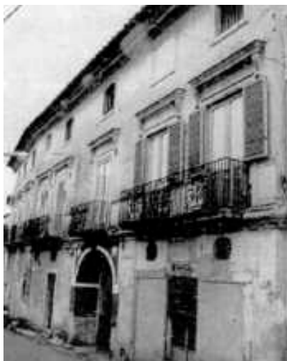
Palazzo de Franciscis, via Canello, Tuoro di Caserta

Capostipite per Caserta è considerato Pietro Antonio che, nel settembre-ottobre 1488, ottenne la commenda del monastero di S. Pietro ad Montes in Piedimonte di Casolla di Caserta.