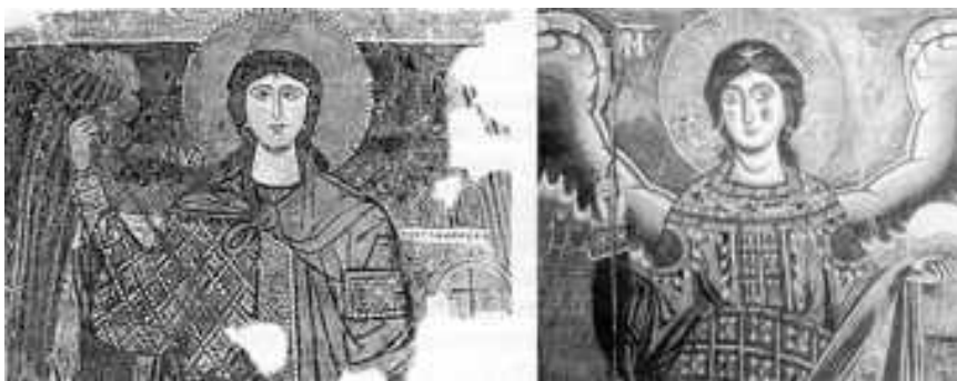
L'Arcangelo Michele: effigi dell'area garganica (Monte Sant'Angelo) e capuana (Sant'Angelo in Formis) (XI secolo)

vita dei Monasteri per soddisfare le esigenze di una sincera e diffusa devozione religiosa.